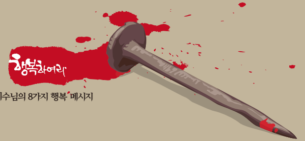
예수님의 8가지 행복 메시지