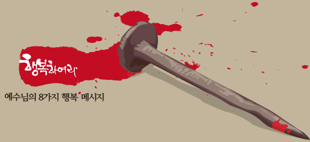
예수님의 8가지 행복 메시지