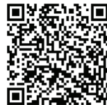
양육강좌 등록 링크 QR