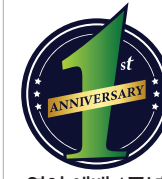
영어 예배 1주년