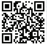
잠언 홀로 묵상(22-24장)