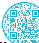
EW QR code