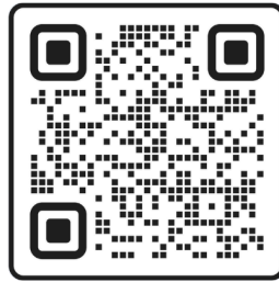
모바일 주보 QR 코드로 스캔하기 Scan the QR Code for Mobile Weekly Bulletin